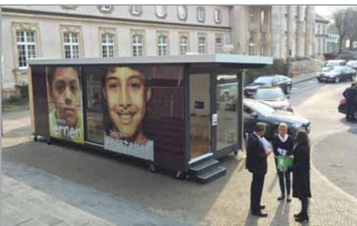
Präsentation der Com-Box beim Deutschen Städtetag in Aachen