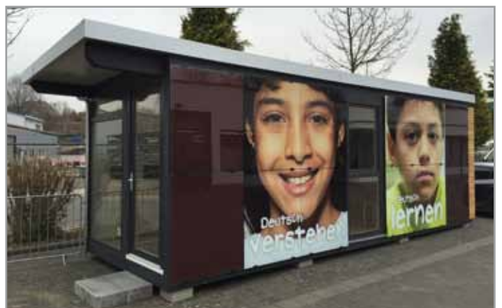
Die erste Com-Box geht in Betrieb: März 2016 Montabauer.